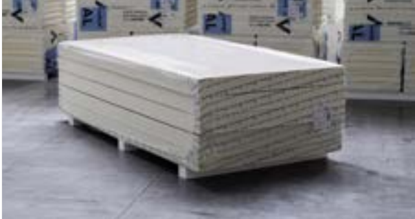
Foto_03_Pakket van 1200x2400 (groot formaat)