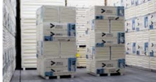
Foto_04_Stapel platen in klein formaat