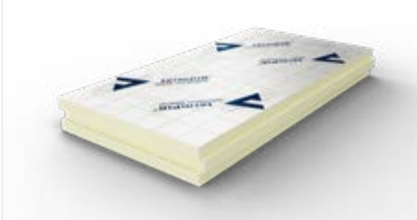
Foto_01_Voorbeeldvisualisatie van een plaat