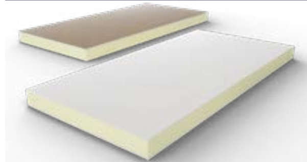
Foto_06_Voorbeeldvisualisatie van een plaat (AL KG)