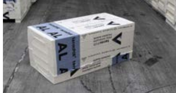
Foto_02_Pakket van 600x1200 (klein formaat)