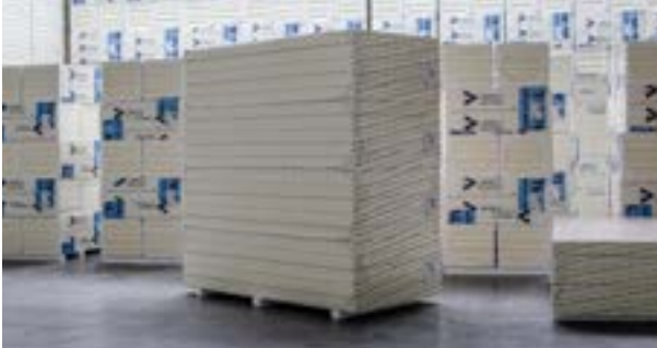
Foto_05_Stapel platen in groot formaat